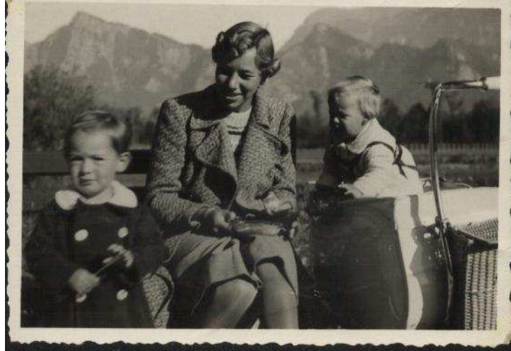
עם אמא ודייזי בשווייץ

עכשיו גרנו בחדר אחד עם שתי הילדות. בעצם אישרו לנו שהייה של 8 ימים, אך השגנו הארכה דרך ה-Joint.