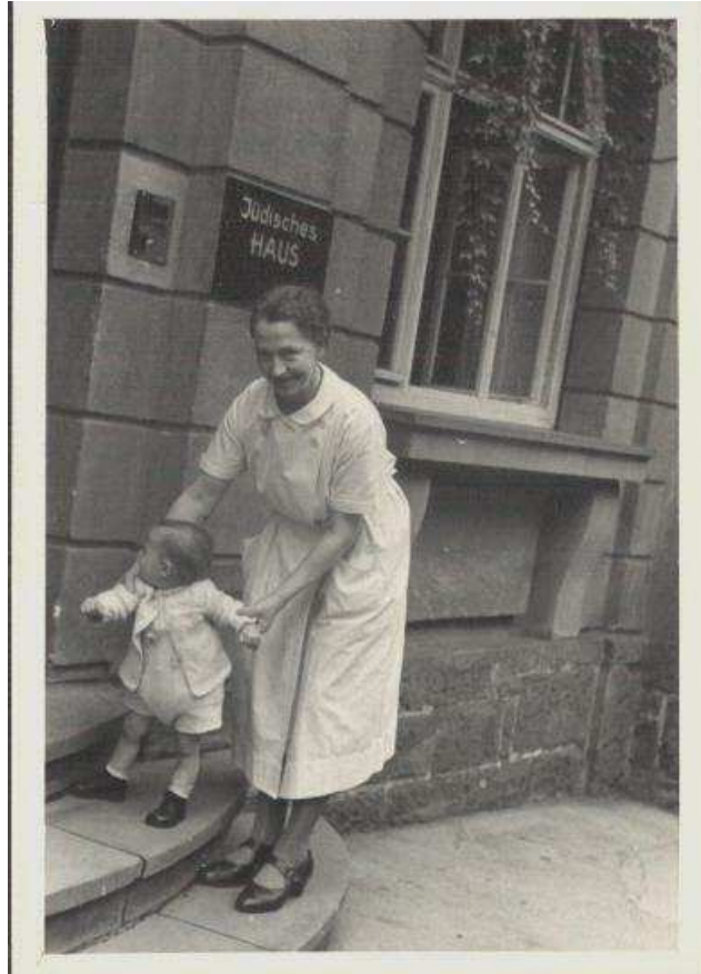
אני ביחד עם המטפלת. על הבית כתוב "בית של יהודים"

בינתיים בעלי ואני – או יותר נכון אני, עם האינטואיציה הנשית החזקה שלי – הרגשנו שגם לצ'כיה יגיע "המבול". בסוף אוגוסט 1938 עלינו על מטוס זעיר ל-12 נוסעים. היעד: איטליה, ומאוחר יותר שוויץ. גרנו בחדר קטן בעיר ציריך."