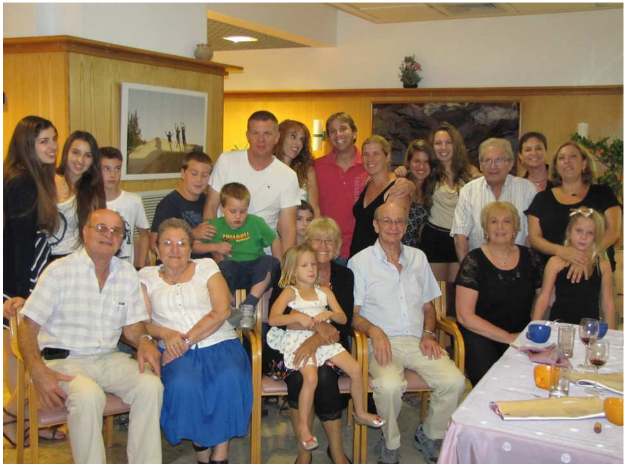
יום הולדת 75 עם המשפחה