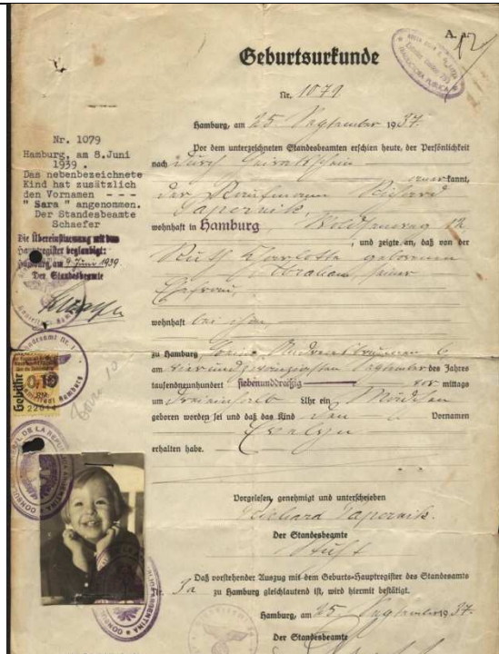
תעודת הלידה שלי

ייום אחד הגיעה ההצלה! בחברת הובלות Hapag - Loyd (שקיימת עד היום) – הציעו לסבתא מסלול: