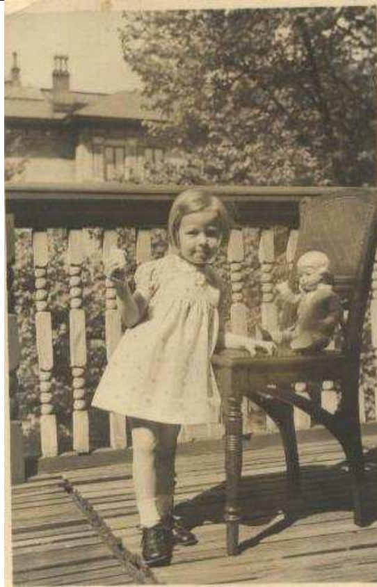
במרפסת אצל הידיד של סבתא

אני זוכרת את החדר. מזוודת-ארון גדולה, שולחן עגול בו סבתא כותבת, תופרת לומדת ספרדית. מיטת הסורגים שלי. ולפתע אני שוב חשה קטנה, בתוך המיטה ההיא, וסבתא באה לערוך את טקס 'הלילה טוב' הקבוע: היא נותנת לי תה מתוק מכפית, וכל פעם מכווצת את עיניה בחיבה ונדה בראשה. "ליל מנוחה מתוקה שלי, ושאלוהים ייתן ויביא אותנו להורים ולדייזי."